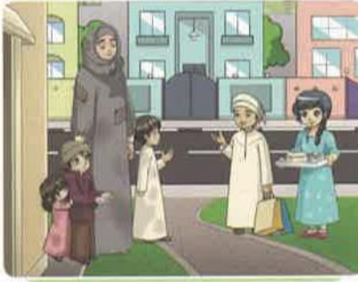
العطف على الفقير